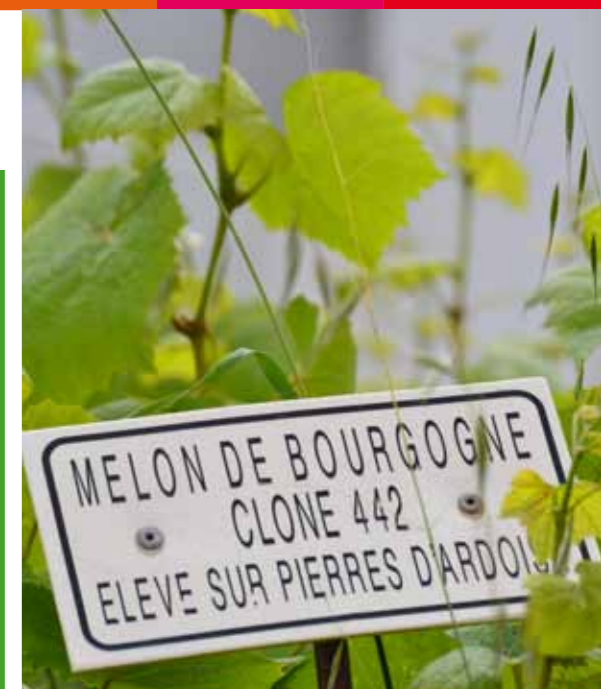
Le Pallet, Timothée COGREL