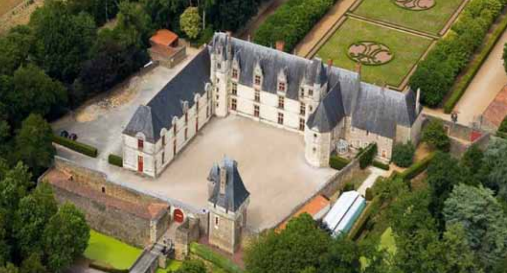
Le château de Goulaine accueillera « les Agapes », le dimanche 7 octobre. Au menu : dégustations mets/vins et intermèdes artistiques