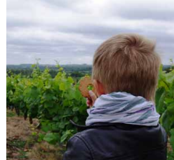
Marais de Goulaine, Stéphane GUET