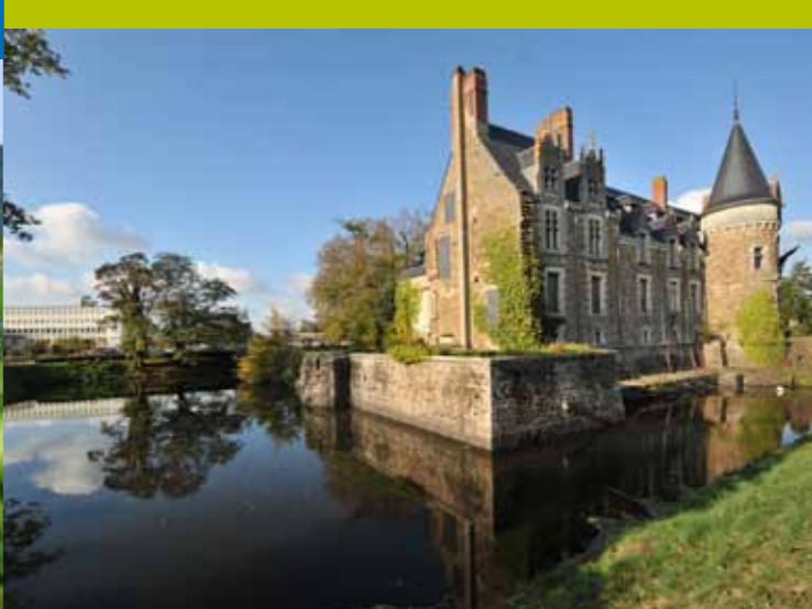
Château de Briacé, Le Landreau