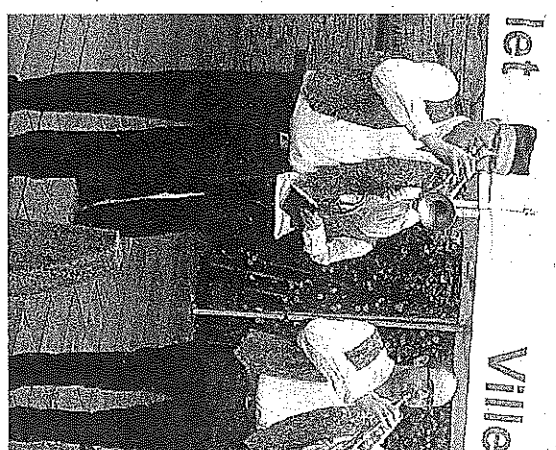
Le Spectre d'Ottokar, musiques traditionnelle

Trois ans avec le Ragon L'association valletaise prépare un programme de spectacles sur trois ans, M